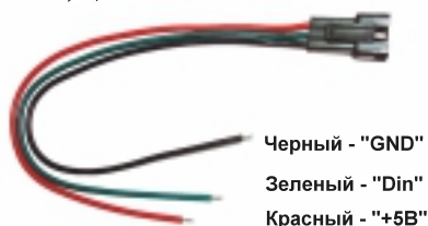
Рис.2. Коннектор для подключения.

Маркировка контактов на ленте: 12V – питание ленты (+12В источника питания), DIN – вход сигнала «DATA», DO – выход сигнала «DATA», GND – общий провод питания и управления (-12В источника питания и GND контроллера).